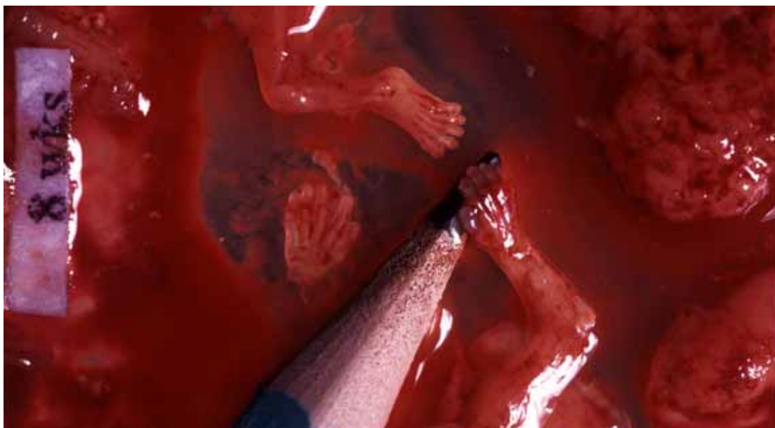
Každé piate nenarodené dieťa bolo v roku 2006 zabitú umelým potratom. Potrat v ôsmom týždni tehotenstva.