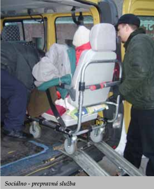
Sociálno - prepravná služba

SOCIA na zakúpenie schodolezu za viac ako 200 000 Sk. Vďaka ich opätovnej podpore sme tieto financie získali a dnes už toto veľmi potrebné zariadenie vo veľkej miere využívame. Touto službou zabezpečujeme chorým a postihnutým občanom styk s verejnosťou, ako napr. vybavovanie na úradoch, návštevy príbuzných, účasť na kultúrnych a športových podujatiach, a tým im pomáhame zaradiť sa do normálneho života a pozrieť sa tak ďalej, za priestor svojho bytu, na ktorý boli doposiaľ odkázaní.