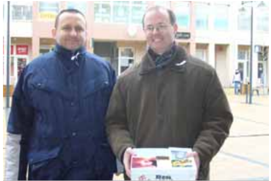
Dobrovoľníci z púchovského o. z. S láskou k človeku.

Povzbudilo ma, keď som pripínala stužky mladým