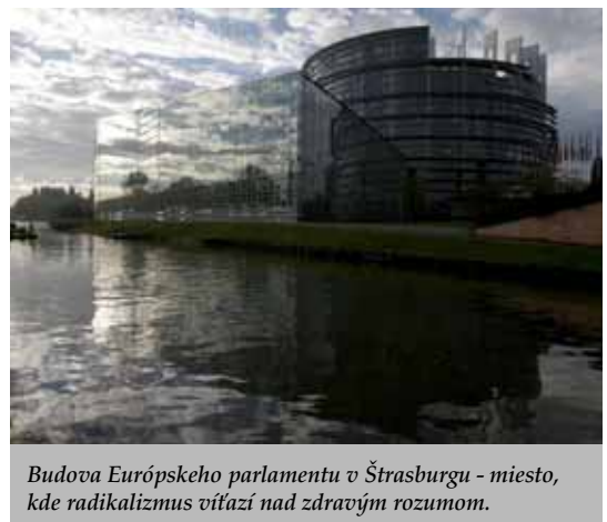
Budova Európskeho parlamentu v Štrasburgu - miesto, kde radikalizmus víťazí nad zdravým rozumom.