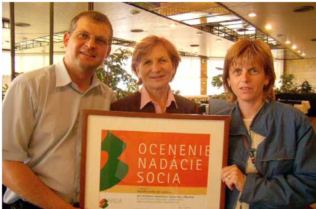
Samaritán získal v roku 2007 ocenenie nadácie SOCIA za systematické zvyšovanie profesionality opatrovateľskej a prepravnej služby seniorov v regióne Turca.

ľudia – hoci boli ešte mobilní – nemali možnosť dostať sa z domu, pretože napr. autobusová a vlaková doprava nebola pre nich vyhovujúca. Preto naša organizácia vďaka finančným prostriedkom získaným z nadácie SOCIA zakúpila 8-miestny automobil Renault Trafic a od 1. 2. 2003 poskytuje sociálno-prepravnú službu /SPS/ pre obyvateľov nášho regiónu. Vďaka špeciálnej úprave môžeme prepravovať aj imobilných občanov. Od novembra 2006 sa náš vozový park rozrástol po zakúpení nového 8-miestneho vozidla Nissan Primastar, ktorý je tiež špeciálne upravený certifikovanou firmou, a tak prispôsobený na prepravu súčasne dvoch imobilných občanov, čím sa zvýšila aj kvantita SPS. Nové vozidlo sa nám podarilo zabezpečiť vďaka podpore z Fondu sociálneho rozvoja v sume 400 000 Sk, MPSVaR v sume 100 000 Sk a ostatných 450 000 Sk z 2 % dane z príjmov. Vzhľadom na to, že je veľmi často potrebné prepravovať občanov z budov a zariadení, kde chýba bezbariérový prístup, rozhodli sme sa podať projekt do nadácie