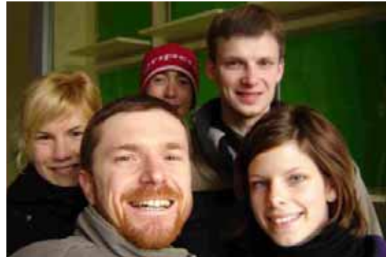
Mladí dobrovoľníci z Námestia SNP

Medzitým sa už naši dobrovoľníci udomácnili na Námestí SNP. Bolo dosť nepriaznivé počasie, takže im veľmi dobre padlo, že im milosrdní bratia dovolili schovať sa do jedného podchodu, z ktorého – keď počasie dovolilo – vybehovali v „nájazdoch“