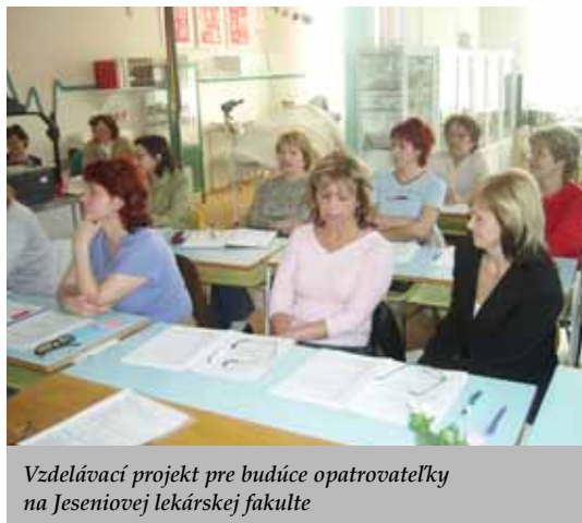
Vzdelávací projekt pre budúce opatrovateľky na Jeseniovej lekárskej fakulte